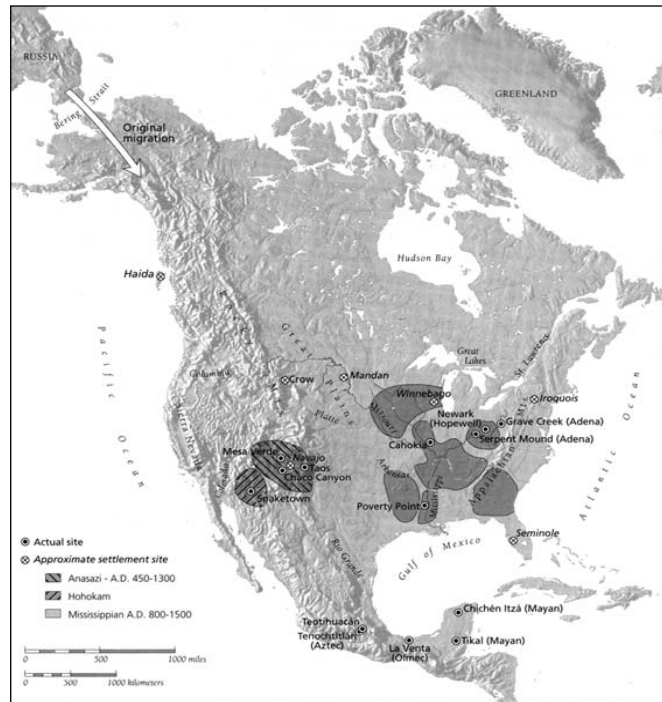
(۱-۱) تمدن های اولیه تا پیش از ۱۵۰۰ میلادی

تاریخ معماری آمریکا با داستان دو دنیای متفاوت آغاز می شود. یکی دنیایی که برای ما شناخته شده تر بوده و منشأ آن اروپاست. دنیایی که در قرن پانزدهم میلادی و همزمان با ورود کریستف کلمب به قاره ی آمریکا، به اجبار وارد این سرزمین شد. دنیای دیگر بخش هایی بود که مناطق آباد و پر از سکنه ی قاره ی آمریکا را از دوران پیش از تاریخ در خود جای می داد. این نواحی پس از ورود اروپائیان، در اثر تاخت و تاز آن ها تقریباً بطور کامل از میان رفت. (۱-۱)